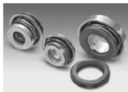
自動車・建設機械