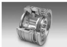
石油化学・鉄鋼・医薬・水・紙・食品

シール技術、特殊溶接技術、動力伝達技術、バルブ技術を大きな柱として、各種メカニカルシール製品、特殊バルブ製品、船用製品、航空宇宙製品、ペローズ応用製品、ダイヤフラムカップリングなど、常にお客様のニーズに合ったものをお届けします。装着された機器内部から、油、溶剤、冷媒などが漏れるのを防ぐ特性から、これらは重要な環境装置の一つでもあり、環境保全および省エネに貢献し、国内外から高い評価と信頼を得ています。